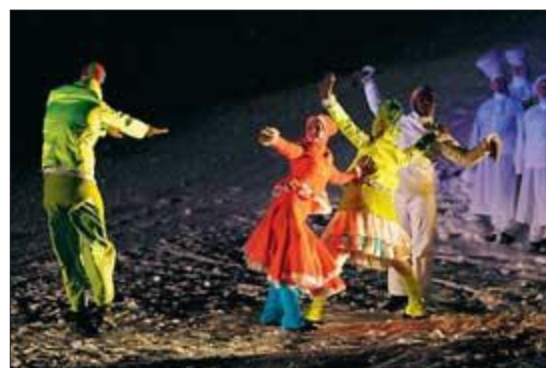
DANS: Publikum fikk oppleve fargerikt dans under premieren på «Mot himlaleite!» i går kveld.